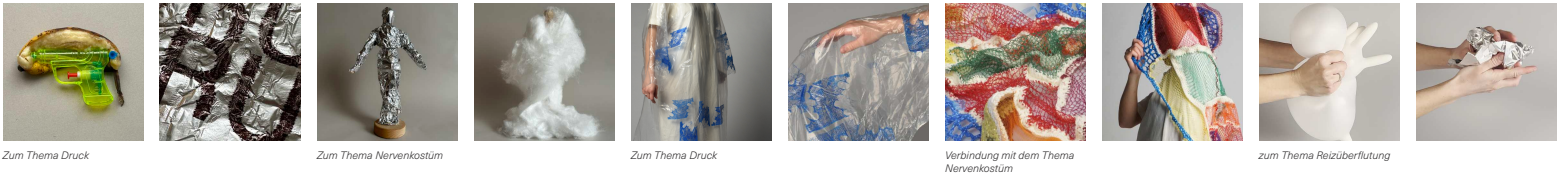
Zum Thema Druck Zum Thema Nervenkostüm Zum Thema Druck Verbindung mit dem Thema Nervenkostüm zum Thema Reizüberflutung